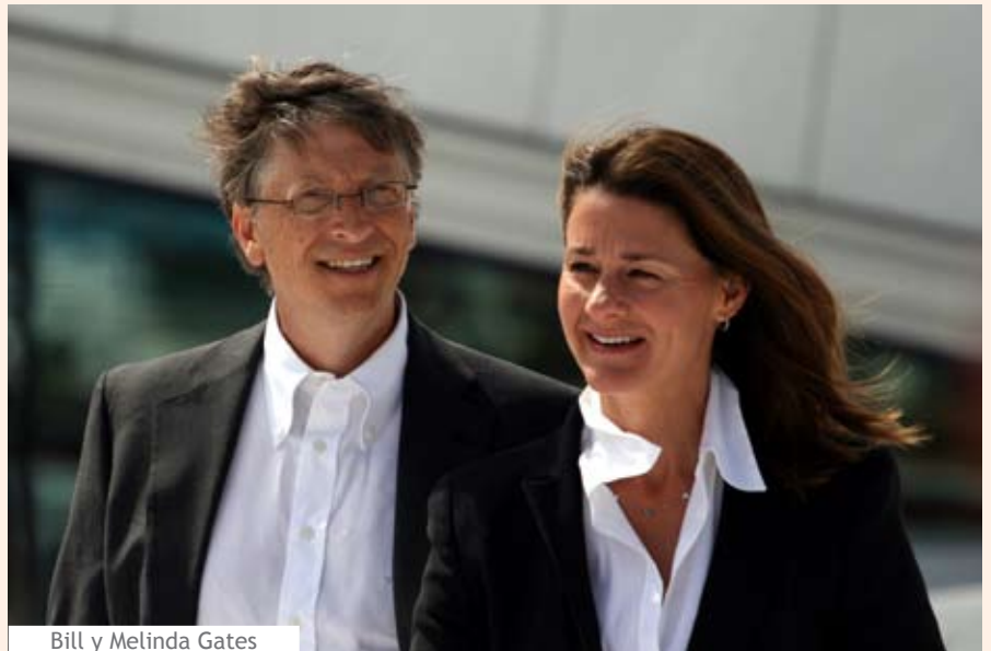
Bill y Melinda Gates

Los líderes ejecutivos que cuentan con un ego alto quizás son los más humildes. Sin embargo, el ejecutivo deberá tener las características innatas que