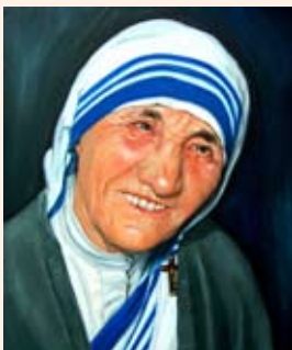
Madre Teresa de Calcuta

A través de la ciencia del talento, nuestra organización ha estudiado miles de ejecutivos legendarios, entre los que se destacan algunos dirigentes de organizaciones con campañas de responsa-